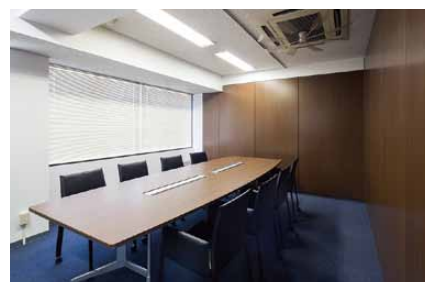
Meeting Space [応接会議室]