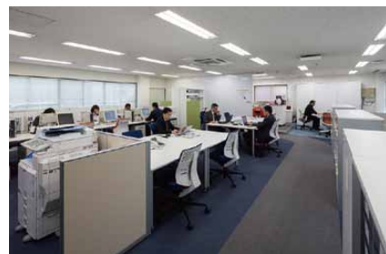
Free Address [営業フリーコーナー]